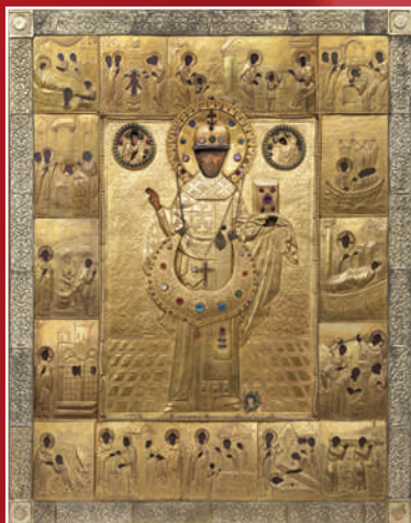
Почитаемая икона свт. Николая Зарайского

Основание Благовещенской церкви г.Зарайска тесно связано с трагическими событиями смутного времени. В 1608 году 30 марта по старому стилю близ Черной Слободы г. Зарайска произошло кровопролитное сражение русских ратников с войсками самозванца Лжедмитрия II, которыми командовал полковник Лисовский. На помощь захваченному Зарайску прибыли добровольные дружины из Арзамаса и Рязани. Поляки, значительно превосходя численностью защитников города, совершенно разбили подкрепление, причём арзамасцев погибло 300 человек. Польский военачальник велел похоронить павших русских воинов в одной братской могиле и насыпать высокий курган.