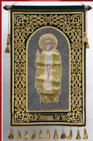
Памятная хоругвь, подаренная Благовещенскому храму арзамасцами в день 400-летия сражения русских войск с войсками Лжедмитрия II, состоявшегося в 1608 году

22 июня 2008 года к торжествам посвященным 400-летию сражения с польско-литовскими интервентами в Смутное время, территория вокруг Благовещенского кургана подверглась серьезной планировке и благоустройству. Ранее установленный в 1962 году обелиск был перенесен к подножию, и на холме появился высокий металлический крест, изготовленный в Арзамасе и переданный в дар нашему городу. Приехавшие арзамасцы подарили Благовещенскому храму вышитую хоругвь с изображением иконы прп. Серафима Саровского – покровителя Нижегородской земли.