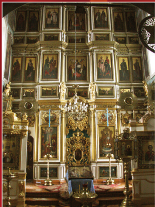
Иконостас главного придела