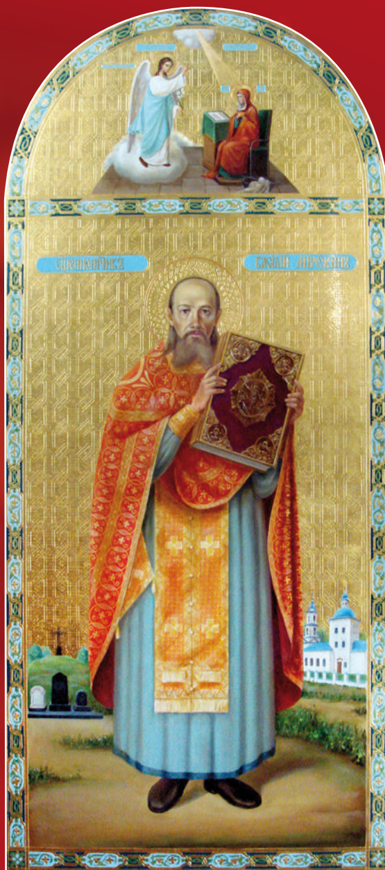
Священномученик Василий Мирожин

Хочется назвать ряд священнослужителей, связанных с Благовещенским храмом. После 1917 года, когда начались гонения на Православную Церковь, был рукоположен к Благовещенскому храму священник Василий Мирожин прославленный ныне в лике Новомучеников и Исповедников Российских. 5 сентября 1937 года 72-летнего отца Василия арестовали и приговорили к 10 годам заключения в исправительно-трудовом лагере за призыв других священников более ревностно проповедовать Слово Божие за богослужениями. 20 декабря 1941 году в Мариинском пересыльном пункте Кемеровской области, настоятель Благовещенского храма г. Зарайска протоиерей Василий Мирожин скончался и похоронен в неизвестной могиле.