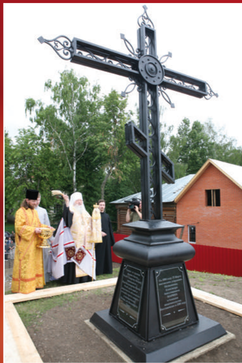
Освящение креста на Благовещенском кургане, 2008 г.