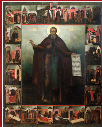
Икона прп. Сергия Радонежского, конца XVII века